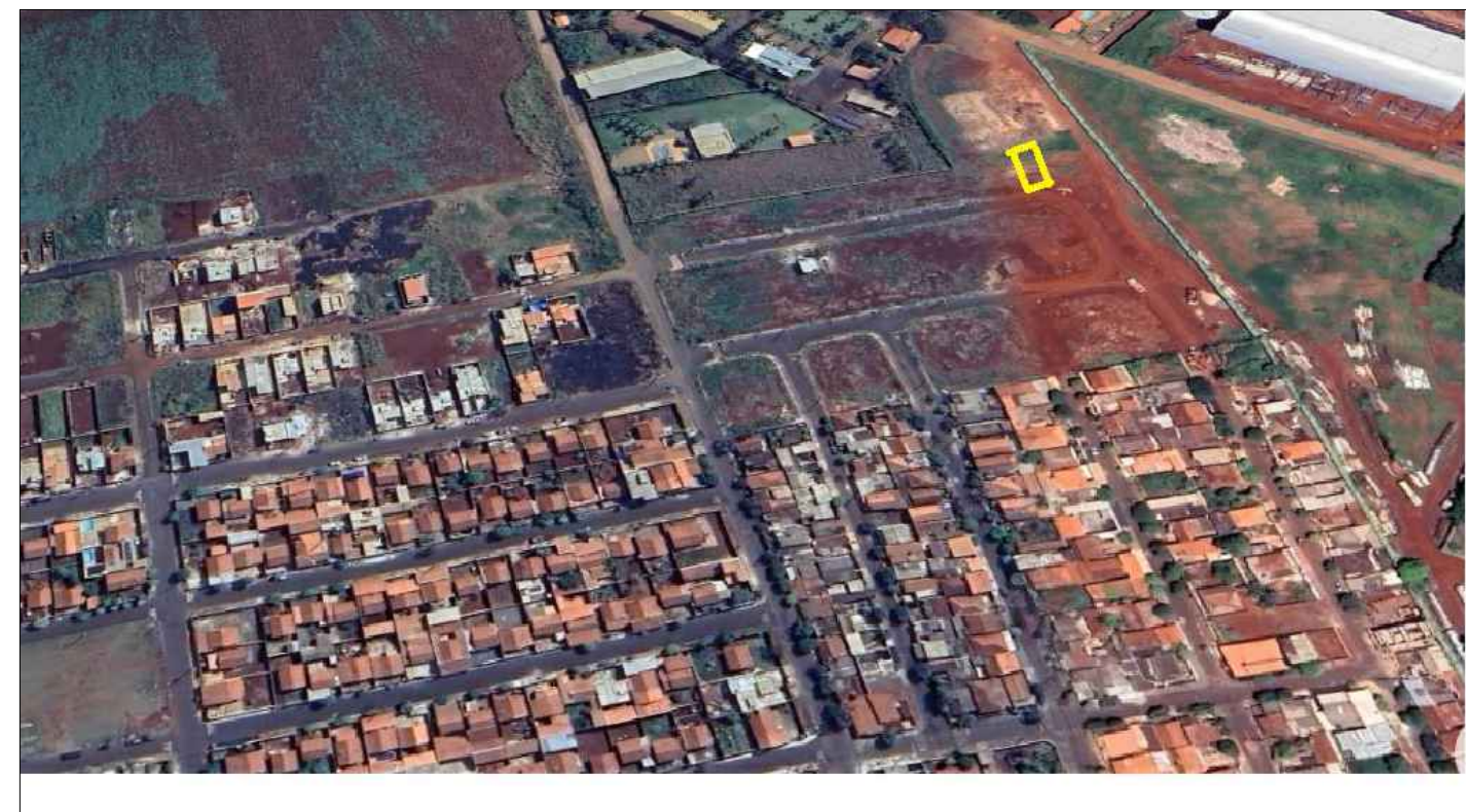
Local da obra - Imagem google SEM ESCALA